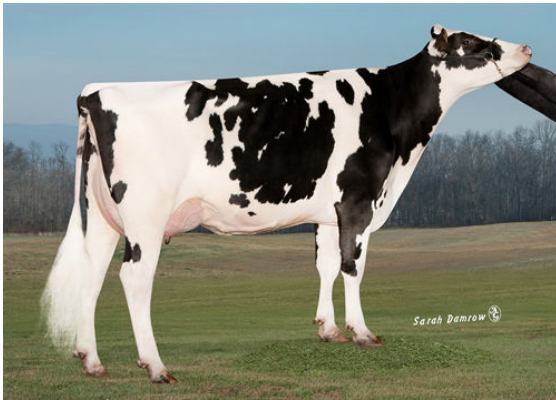
CO-OP BLUMEN DAY 4292 GRANDDAM